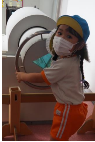
ソラール見学に行ったよ